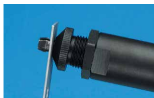
Inserire il punzone (fissato sull'attrezzo 74290) nel foro tondo