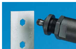
Pezzo con foro esagonale punzonato dalla 74290, pronto per ricevere un inserto filettato Hexsert®