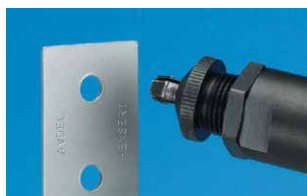
Pezzo con foro tondo